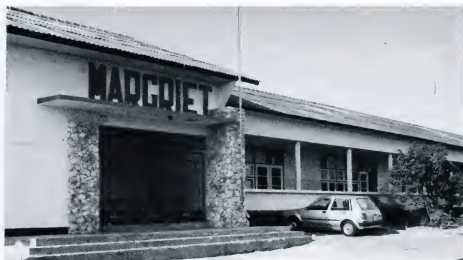
Na sluiting van de Margrietschool nog maar één openbare school in Playal!

Het onderwijsartikel 140 van de Staatsregeling nu bevat beide soorten grondrechten.